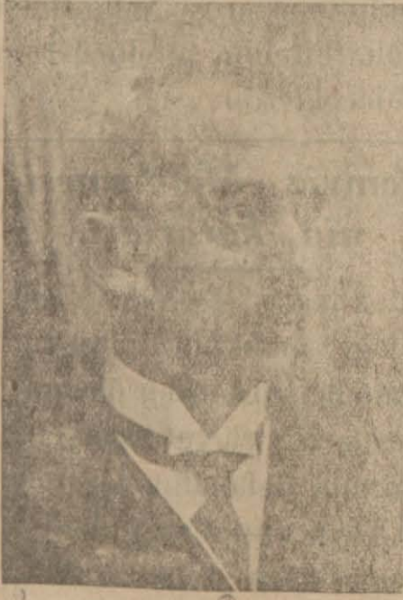
Panayırı açacak olan Başvekil İsmet paşa Hz.